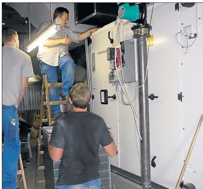
Die Arbeit der Monteure auf der Baustelle ist fast immer Teamwork.

Zu einem solchen Jubiläum kann Viessmann nur gratulieren. Und jubilieren.