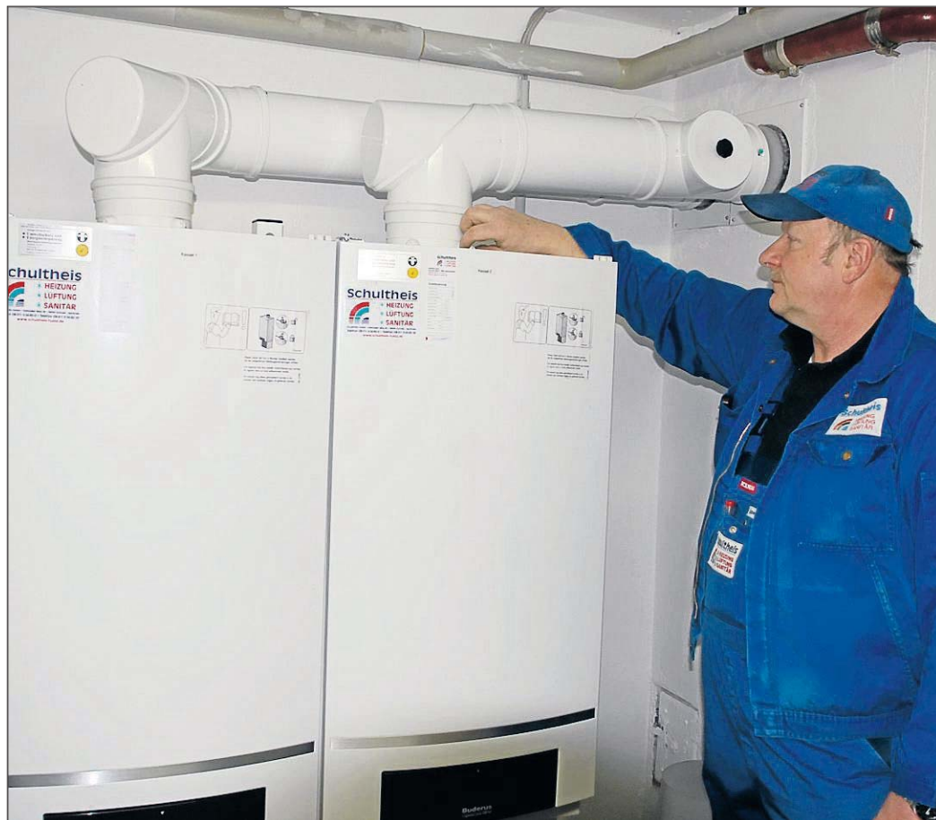
Heizungs-, Lüftungs- und Sanitäreanlagen werden sicher überwacht.

Auch zahlreichen privaten Bauherren in der Region war Schultheis ein stets kompetenter, zuverlässiger Partner.