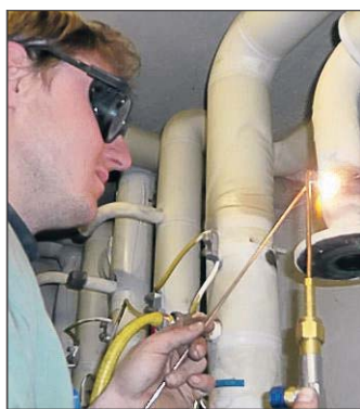
Schweißarbeiten erledigen die Mitarbeiter kompetent.

Rund die Hälfte aller Aufträge kommt für das Unternehmen aus dem Bereich des Gesundheitswesens und der Krankenhäuser. Die meisten Beschäftigten sind dabei in der Regel auf Baustellen im Rhein-Main-Gebiet eingesetzt. Die Monteure genießen einen so guten Ruf, dass zwei von ihnen nach einer besonderen Ausbildung und einer Abschlussprüfung vom Gesundheitsamt ermächtigt wurden, nach der Installation einer Wasserleitung und deren Desinfektion die nötigen Wasserproben zu entnehmen.