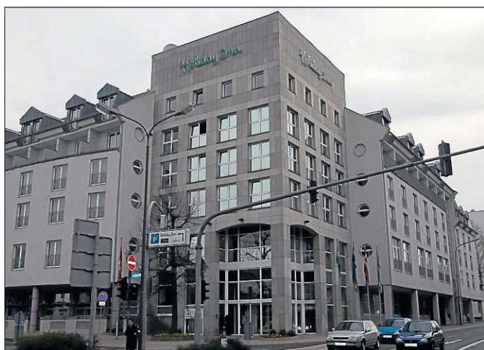
Am Bau des Holiday Inn war Schultheis maßgeblich beteiligt.